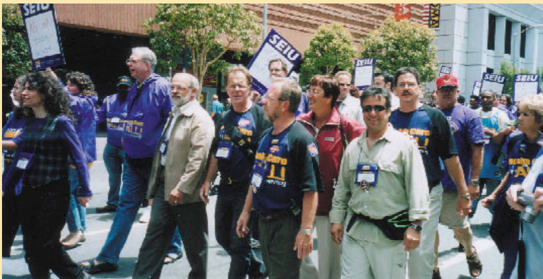
On aperçoit la plupart des membres de la délégations de l'UES 800 au Congrès, lors de la marche vers le pont du Golden Gate.

Le président Andy Stern a donc présenté au Congrès, un ensemble de sept stratégies sur lesquelles l'Union Internationale des employés et employées de service devra travailler au cours des prochaines années. Les voici :